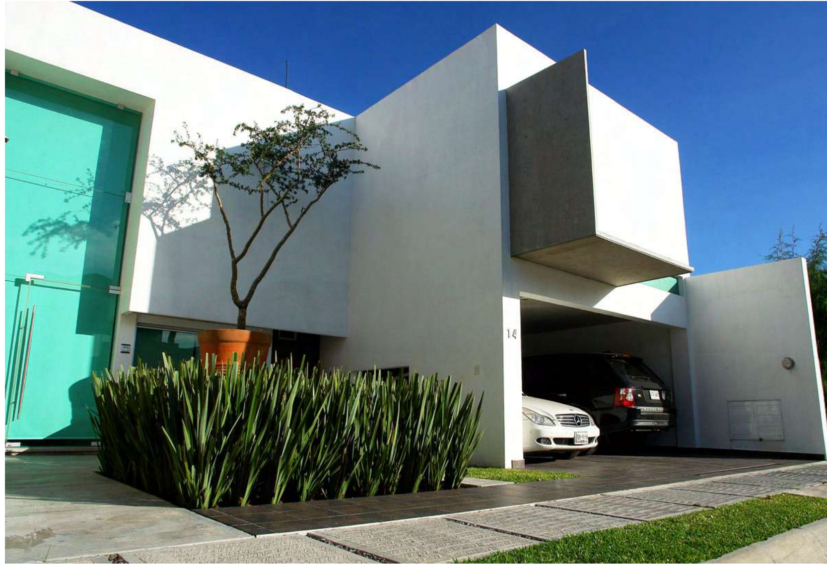
CASA GP (REMODELACIÓN)

A la funcionalidad propia de un inmueble le aplicamos movimiento, amplitud y sensibilidad, pues “la función de la arquitectura debe resolver el problema material sin olvidarse de las necesidades espirituales del hombre” — Luis Barragán.